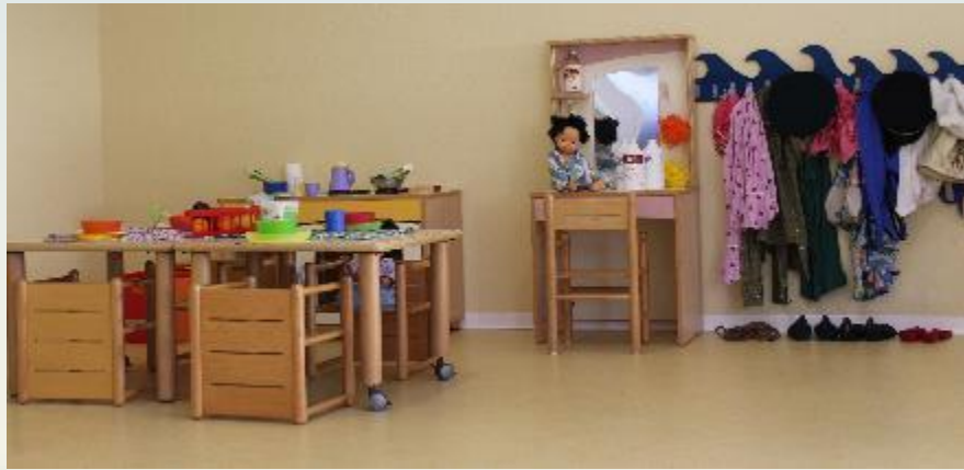
Angolo gioco simbolico casa, Stanza sonno