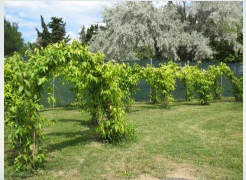
Tunnel di siepe, tronchi come sedute