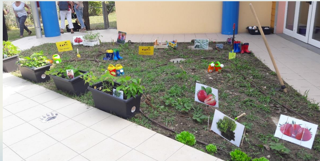
Prendersi cura: progetto orto a terra o in cassetta