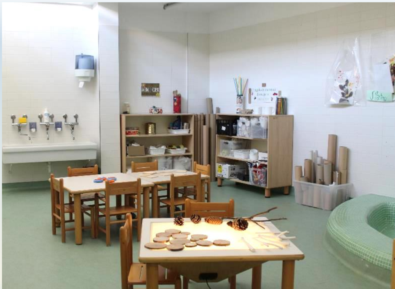
Atelier: attività creative, grafico-pittoriche