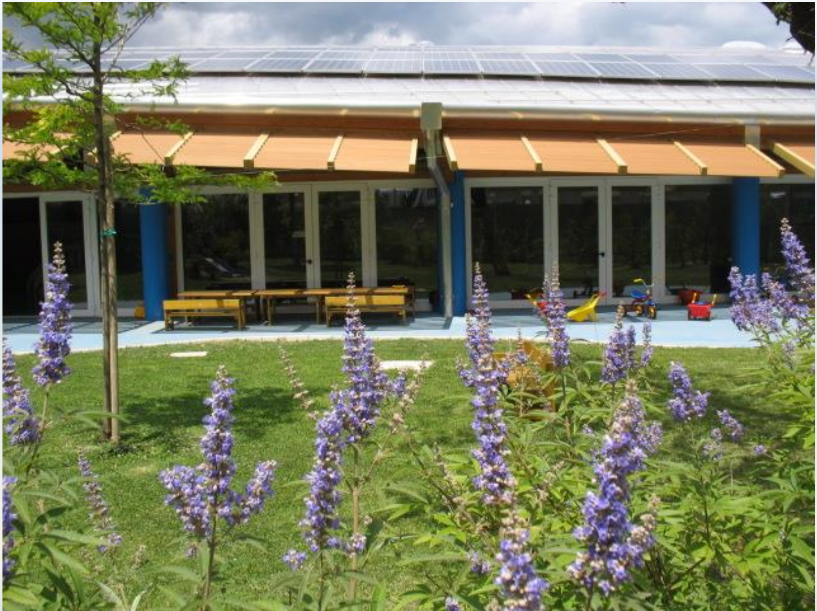
Giardino: varietà piante e ampie zone ombreggiate