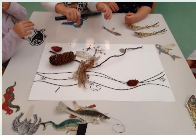
Progetto Atelier multimediale: l'arte raccontata ai bambini 3-6