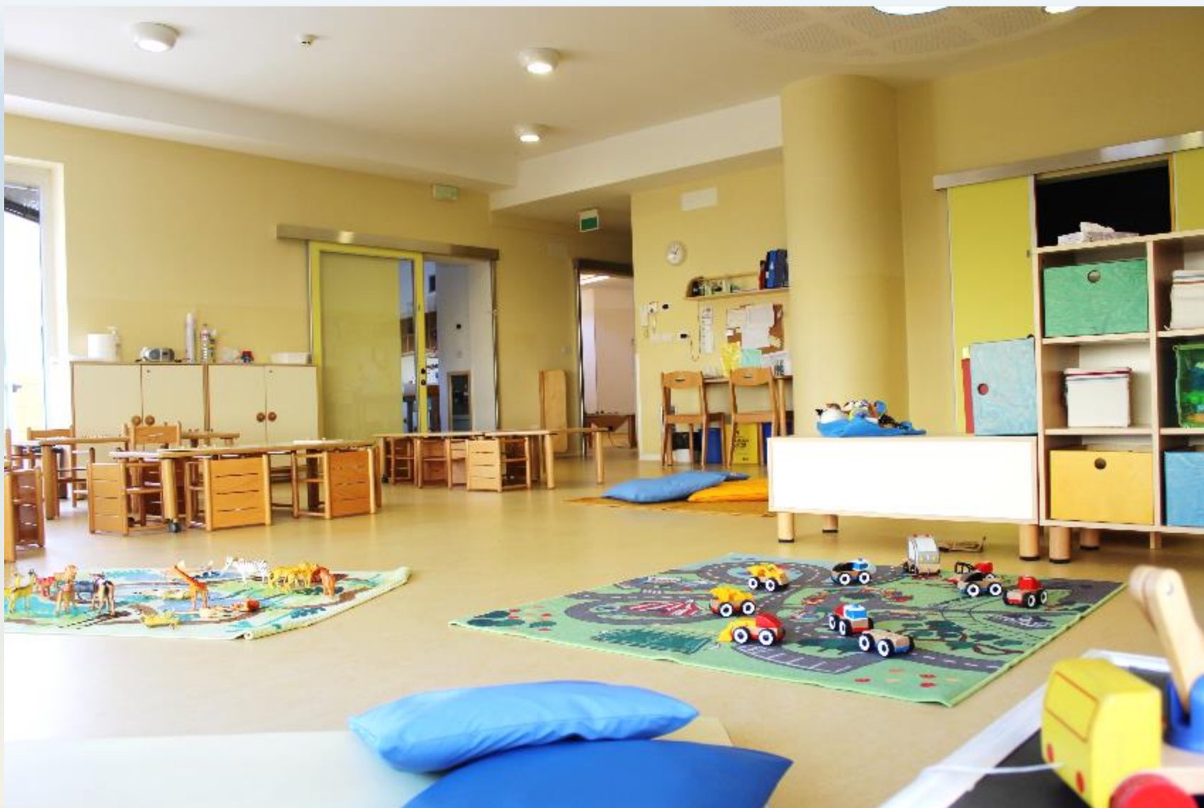
Sezione Gialla (10-32 mesi)