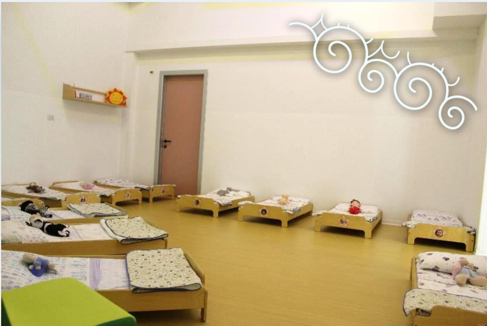
Stanza del sonno