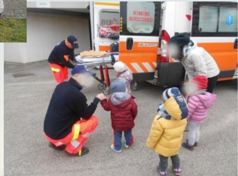
Progetto Strada facendo: piccole uscite a piedi nei pressi del Polo