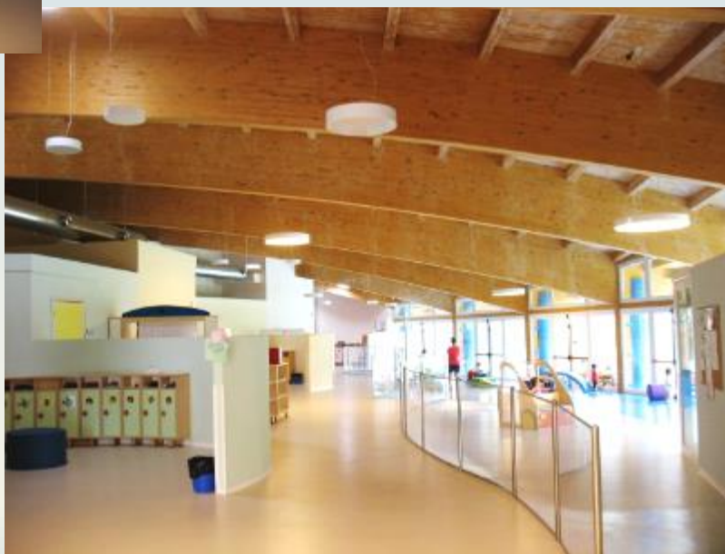
Ingresso comune per nido e scuola infanzia