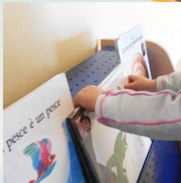
Progetti lettura e narrazione, suoni e esperienze musicali