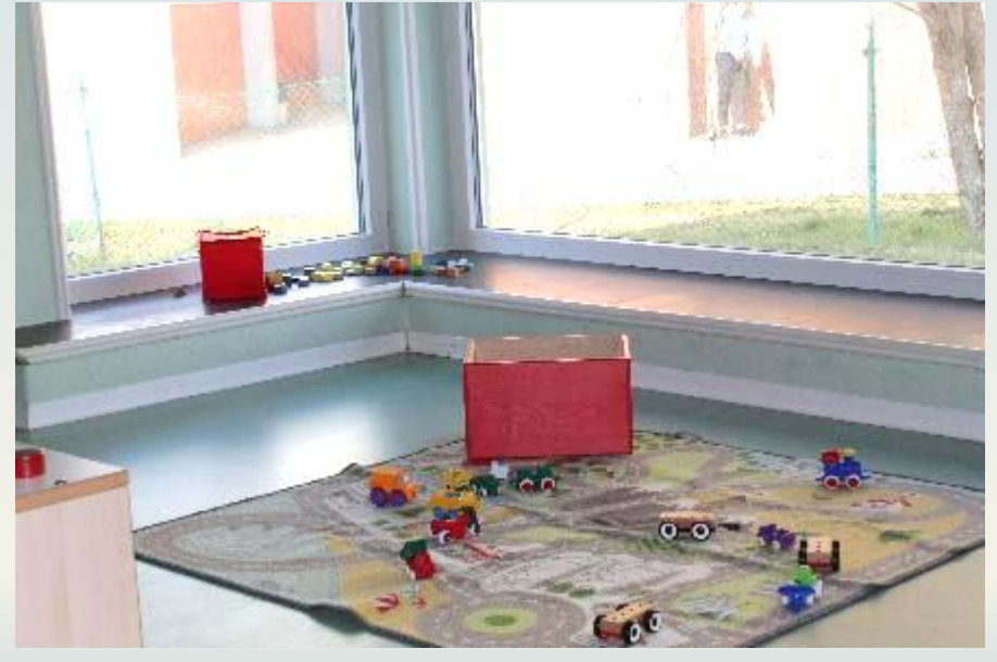
Sezione: due ampie stanze organizzate in centri d'intesse