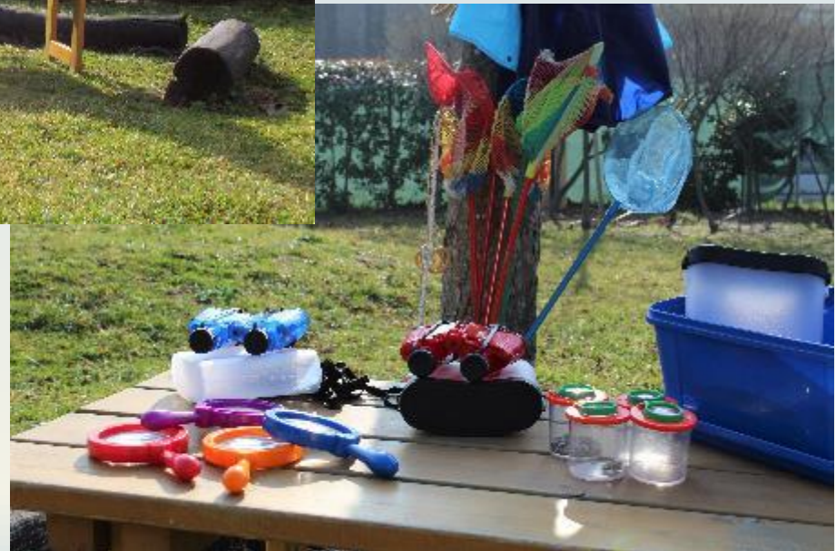
Equipaggiamento per esperienze outdoor